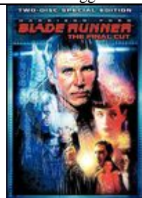
Blade Runner (Final Cut)