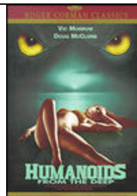
Humanoids from the Deep (1980)